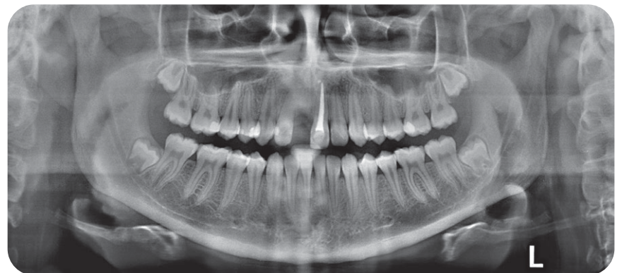
ビスタスキャンコンビビューで読み取ったパノラマ撮影画像